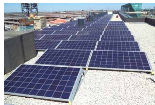
Een deel van de elektriciteit wordt opgewekt door zonnepanelen op het dak.

De houtskelbouwelementen, die tevens dienst deden als randkist, namen we meteen in de ruwbouw mee. De gevelafwerking bestaat uit steenstrips. Traditioneel metselwerk was, gezien de krapte in de bouwsector, niet op korte termijn realiseerbaar. Met de steenstrips behalen we het beoogde architectonische resultaat en kunnen we conform planning opleveren."