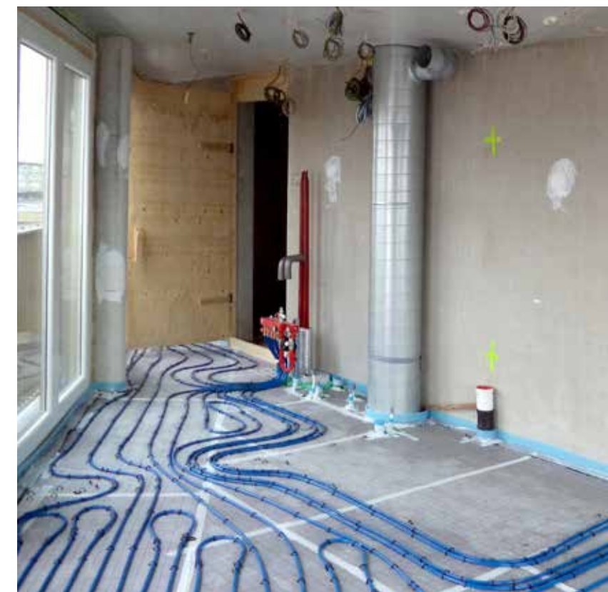
De lage temperatuur vloerverwarming is per vertrek regelbaar.