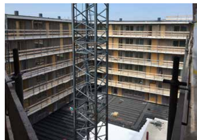
Zicht op de toekomstige binnentuin.

De werkzaamheden staan inmiddels volledig in het teken van de afbouw. "Van beneden naar boven maken we de woningen gereed", zegt Schakel. "Zo zijn op de eerste verdiepingen de keukens al gemonteerd, terwijl op de bovenste verdiepingen het spuitwerk nog plaatsvindt. Ook de aanleg van het straatwerk en de binnentuin en de aansluiting van de nutsvoorzieningen zijn in volle gang. We werken in goede samenwerking met de opdrachtgever en betrokken partijen toe naar de eindoplevering." Op 18 november 2018 zijn de appartementen naar verwachting gereed en kunnen 149 alleenstaanden, jonge stellen en kleine gezinnen genieten van hun nieuwe huurwoning in Leidsche Rijn. ■