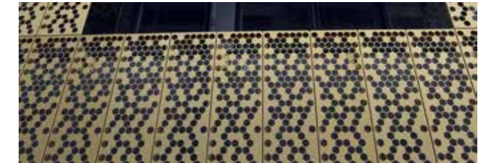
Detail vrij hangende gevel met honingraatmotief.

Over de status van de werkzaamheden zegt Schakel: "De afbouw is in volle gang. We voorzien de laatste verdieping van behang en vloerbedekking. Buiten is de gemeente bezig met het straatwerk." Een complicerende factor tijdens de uitvoering is dat de bouwplaats krap is en dicht tegen het spoor aan ligt. Dit maakt dat De Vries en Verburg zoveel mogelijk materialen just-in-time laat aanvoeren. Voor het werken aan het spoor worden specifieke maatregelen genomen, zoals het aarden van de kranen. "Alles is onder controle", zegt Schakel tevreden. "Half november 2018 leveren wij de woningen op en kunnen 250 jongeren direct verhuizen naar hun nieuwe, eigen stekje." ■