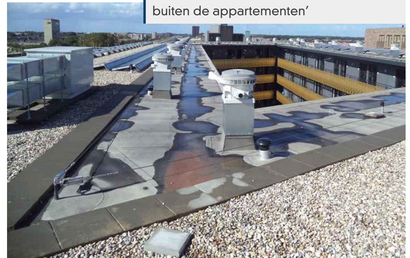
De ventilatie wordt collectief geregeld via drukgerelgde dakventilatoren.

'Een deel van de installaties bevindt zich buiten de appartementen'