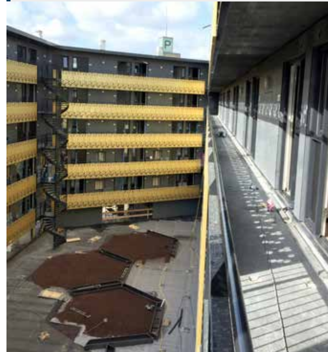
In de binnentuin op het binnendek komt het honingraatmotief terug.

'De appartementen worden compleet opgeleverd'